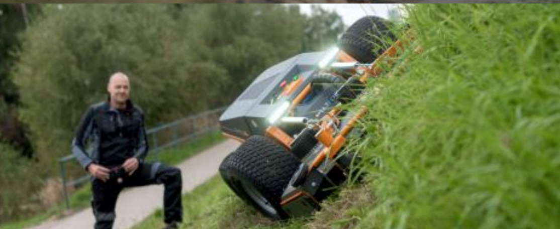
SVAHY A BŘEHY