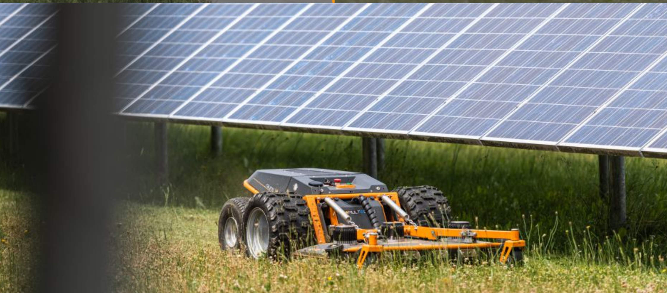
ENERGO PARKY / SOLÁRNÍ ELEKTRÁRNY