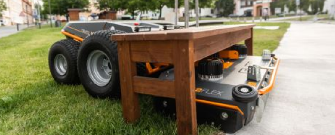
PROSTORY S NÍZKOU VÝŠKOU