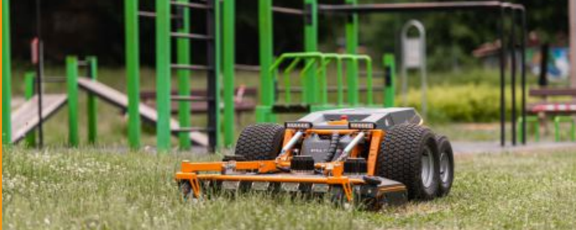
SPORTOVIŠTĚ A HŘIŠTĚ