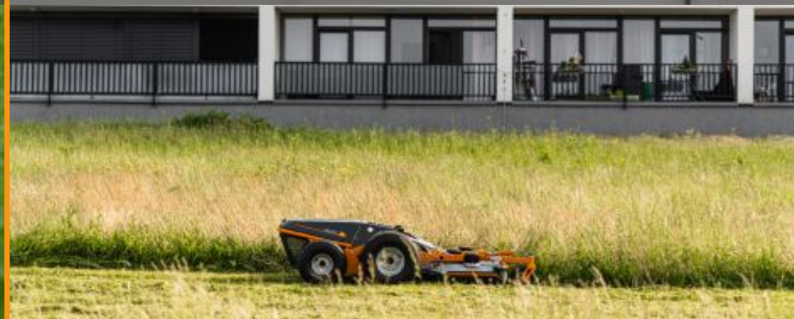
MÍSTA S OMEZENÍM HLUKU