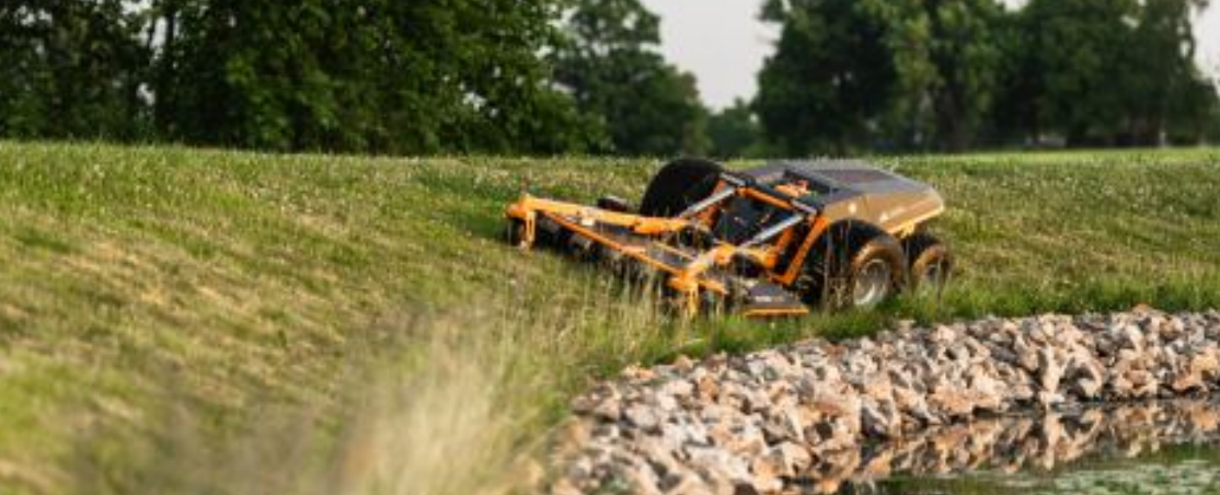
EKOLOGICKY CITLIVÉ OBLASTI